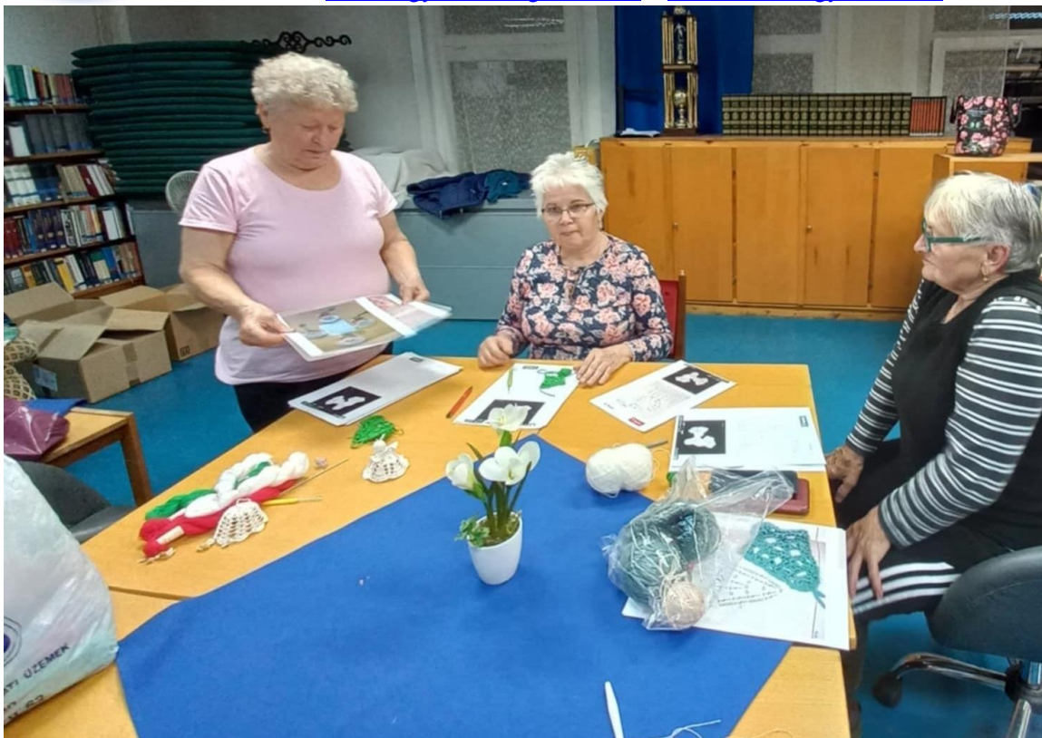
Horgoló szakkör – kicsiknek és nagyoknak